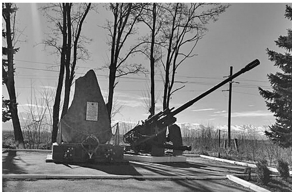
Мемориал памяти павшим защитникам Ардонского района.

Я стал думать о том, как отомстить за маму, которая погибла, можно сказать, от их рук.